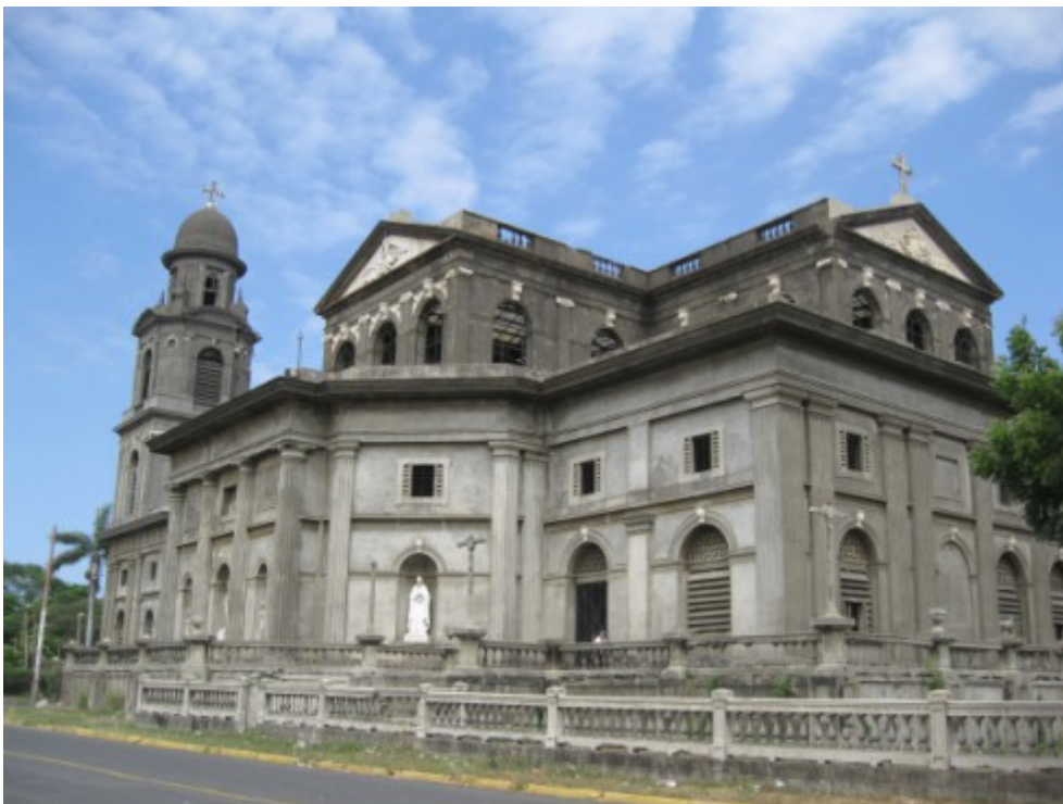
Otra vista de la antigua catedral de Managua.