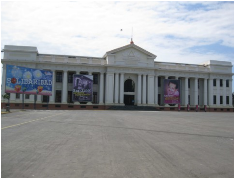
El palacio nacional de Nicaragua (Managua)

También puedes aprovechar la ocasión antes o después participar de los cursos o el congreso para vacacionar en las playas o en el interior del país. Con gusto te ayudaremos a encontrar lugares y hoteles adecuados.