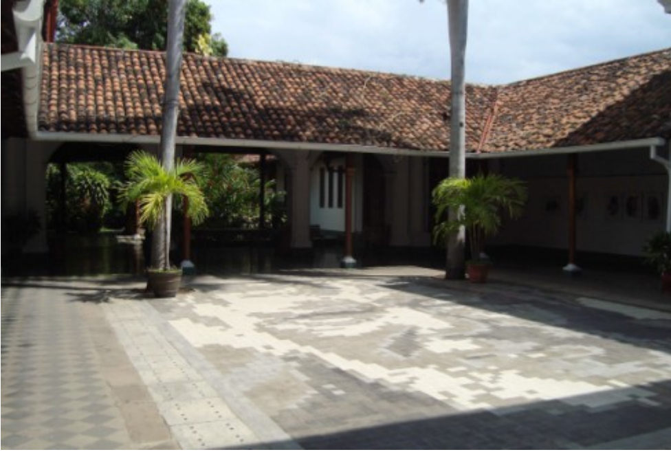
El patio de la “Casa de los tres mundos” en Granada