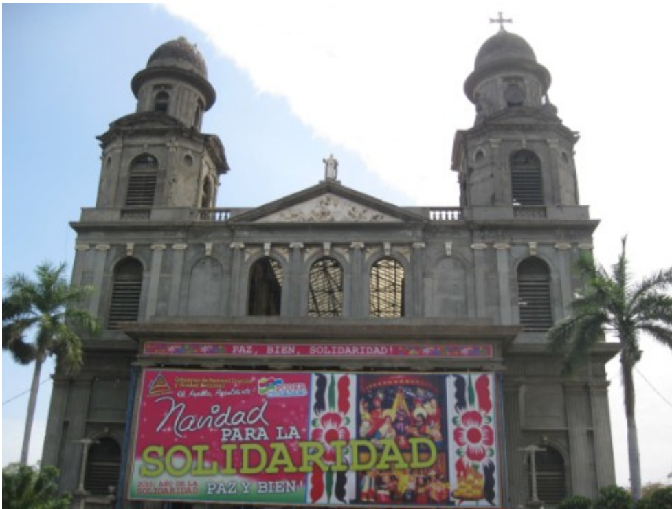
La antigua catedral en Managua.