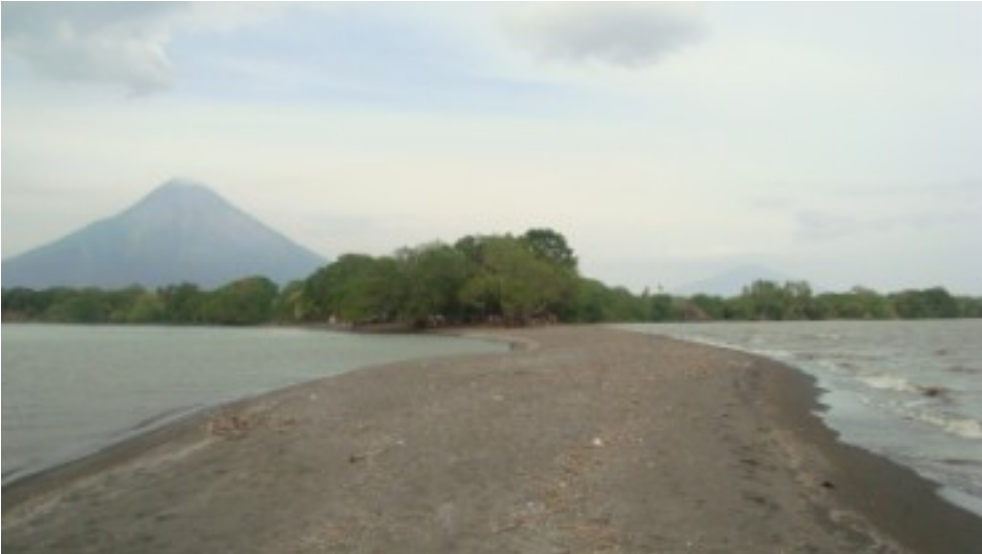
Vista del volcán "Concepción" en la isla de "Ometepe"