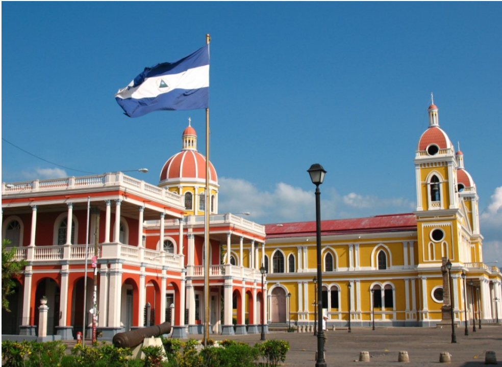
Plaza de la independencia, en la ciudad del congreso “Granada”