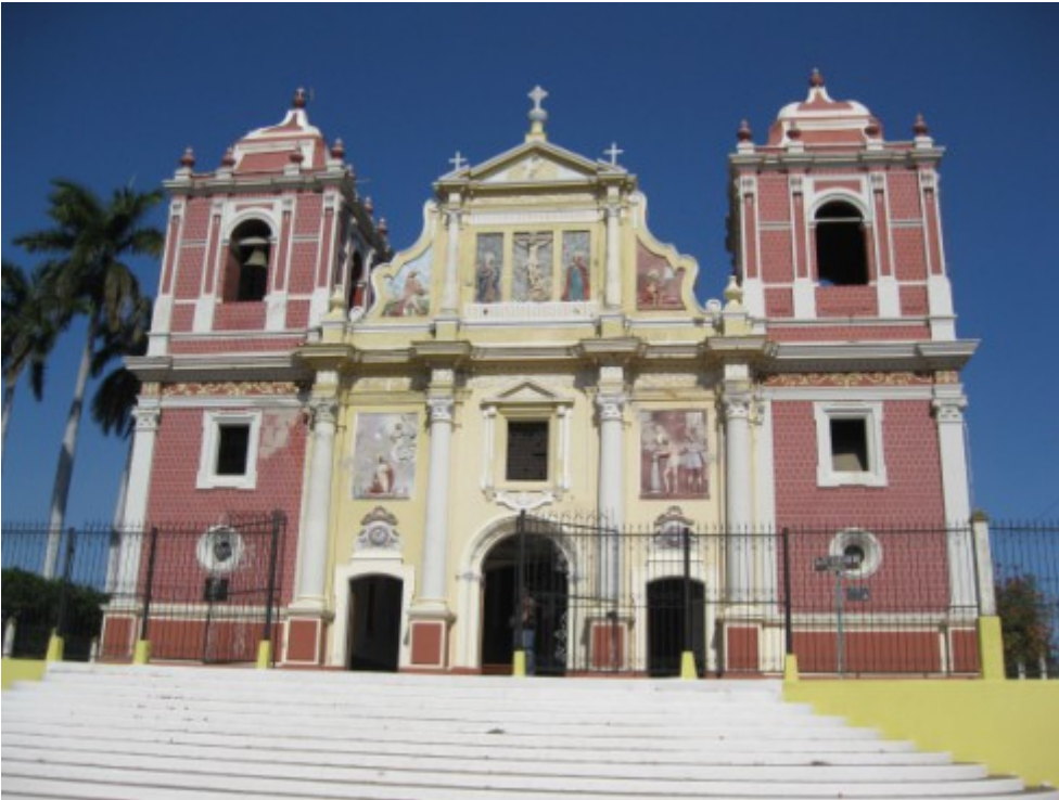
Iglesia “El Calvario” en la ciudad León.